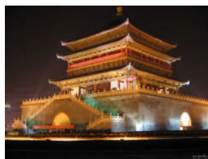
Siano, Ĉinio, aŭguste