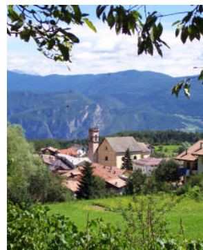
apud Trento, Italio, aŭguste