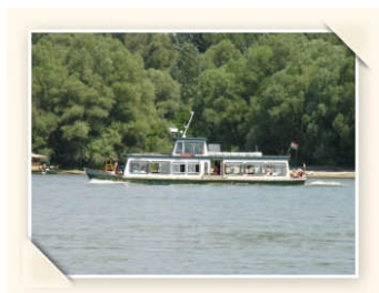
Horány, Hungario, marte