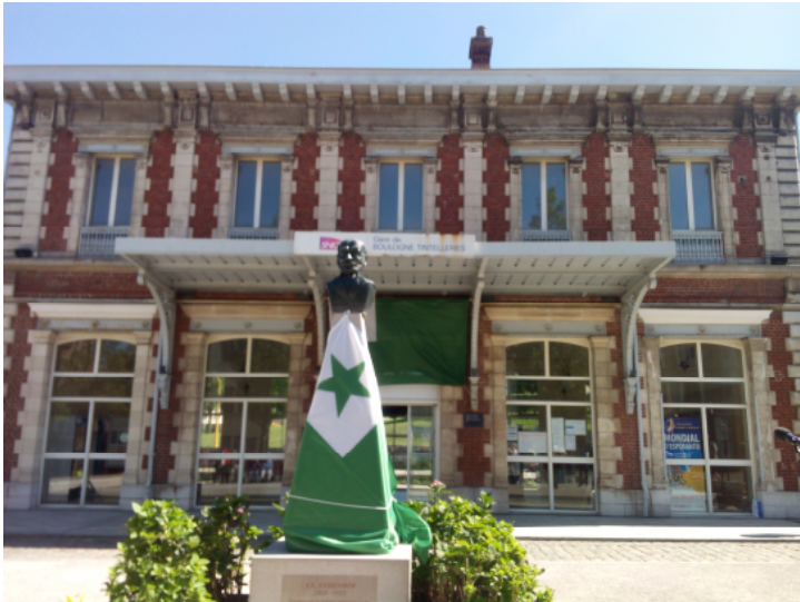
La busto de Zamenhof antaŭ la ceremonio ĉe la stacidomo en Bulonjo, kie en 1905 Zamenhof kaj aliaj kongresanoj eltrajniĝis.