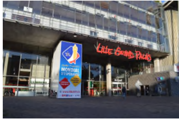
La kongreseja enirejo, kun unu el centoj da afiŝoj tra la urbo.