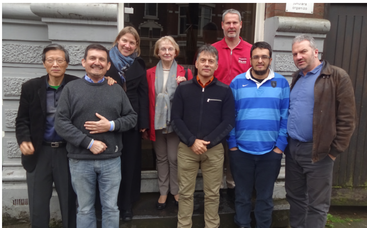
La estraro, ĝenerala direktoro kaj la nova redaktoro de revuo Esperanto en la kutima fotoloko.