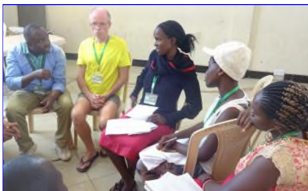
Unu el la multaj diskutgrupoj – interago de ideoj.