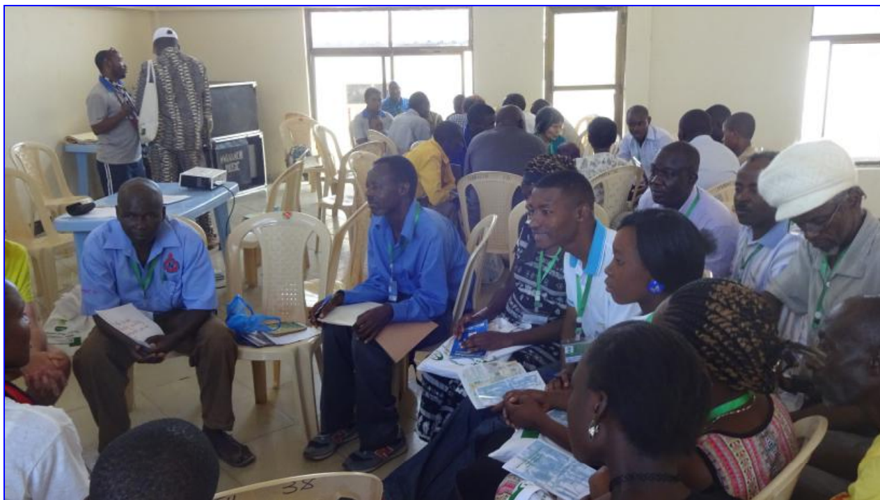
Bone ĉeestata kaj inda afrika AMO-seminario. Multo el la programo konsistis el grupaj diskutoj