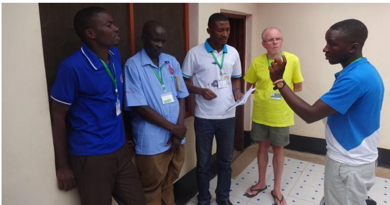
Diskutoj kaj planoj pri la junulara agado – la debatoj daŭras en la korto post la formala kunsido.