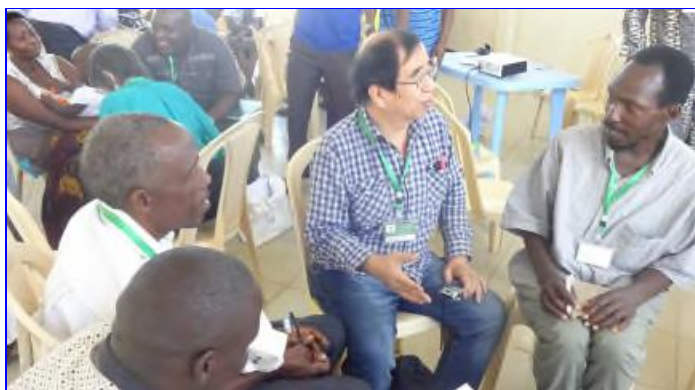
Azio kaj Afriko kune debatas.