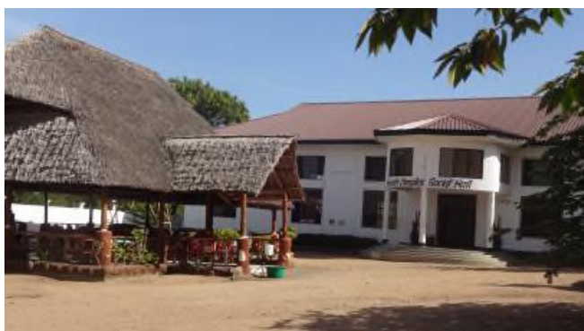
La kongresejo meze kaj la manĝejo maldekstre.