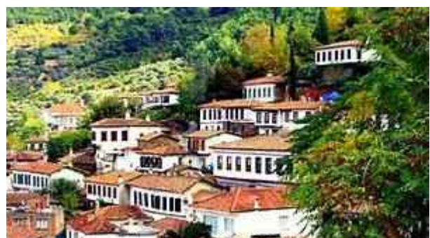
Sube kaj sekvapaĝe: fotoj de Izmir, la enirejo al Cesme kaj Sinince.