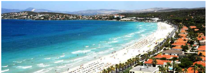
Fotoj supre: vidoj de Cesme. Sube: vidoj de Sirince.