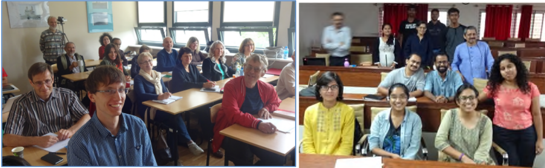
Pliaj universitataj kursoj: el UAM en Pollando (Poznan) kaj la Universitato Azim Premji en Bengaluru, Barato.

Vi trovos ĝin rekte en la paĝo: https://edukado.net/kursejo?kid=27286